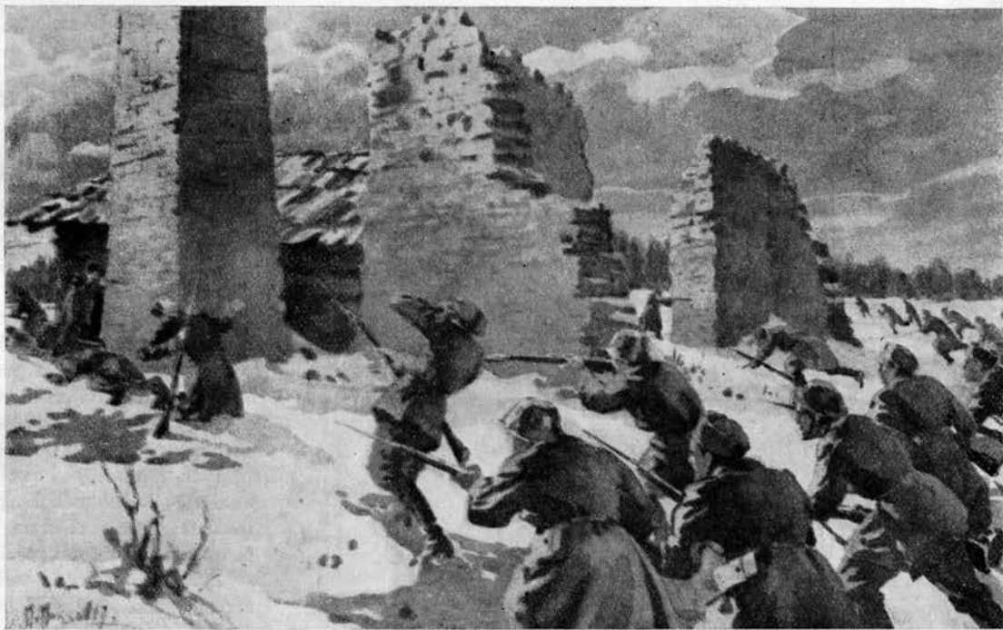
Paju lahing 31. jaan. 1919. a.