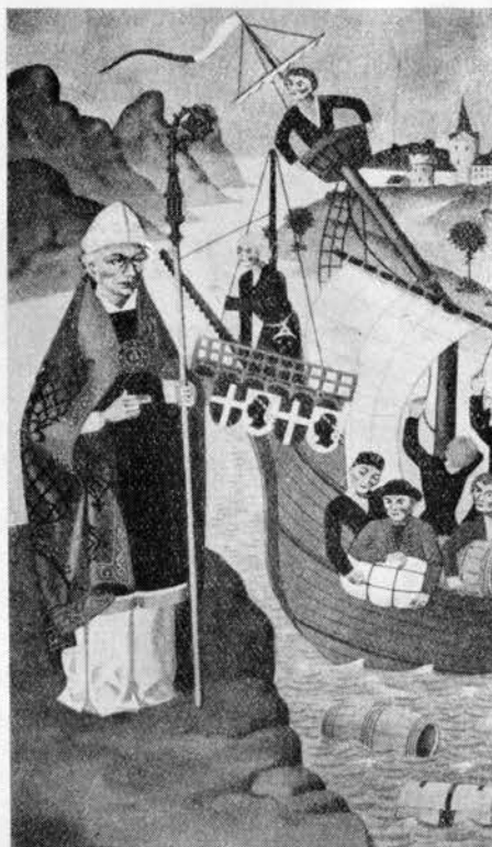
Merehädaline kaubalaev keskajal.